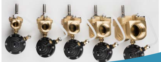
Pro1 i ventilstorlekar DN20 - DN50

Leakomatic Pro1 skyddar fastigheten genom att upptäcka läckagen i vattenledningarna, såväl vattenflöden som små dropläckage.